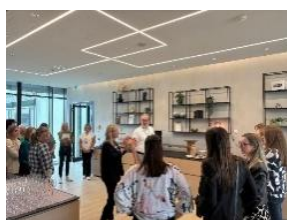
Heller, freundlicher Pausenbereich – exklusiv für unsere Teilnehmer:innen

Ein Highlight ist der Veranstaltungsbereich mit modernen Seminarräumen , die teilweise direkten Zugang zur Terrasse bieten, auf der sich auch die hoteleigene ROOF Bar befindet. Genießen Sie diese helle, freundliche und damit inspirierende Atmosphäre während Ihrer Weiterbildung. Kulinarisch ergänzt ein Restaurant mit Blick über die Stadt sowie Bar- und Cafébereiche das Angebot, während Fitness- und Saunabereich des Hotels für Entspannung sorgen.