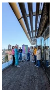
Angrenzende Terrasse, die als ergänzender Seminarraum genutzt werden kann.