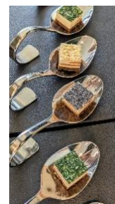
Kulinarisches Verwöhn-Programm in den Pausen, am Snack-Buffer